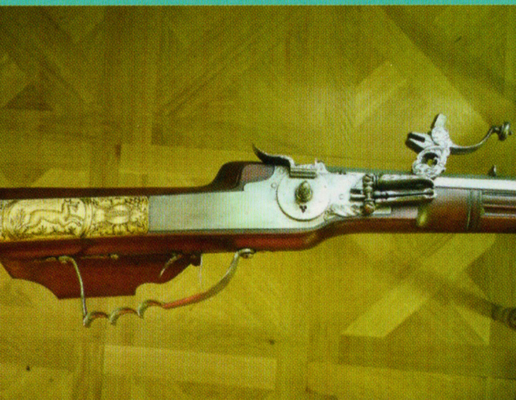
Radschlossbüchse, 2. H. 17. Jb.