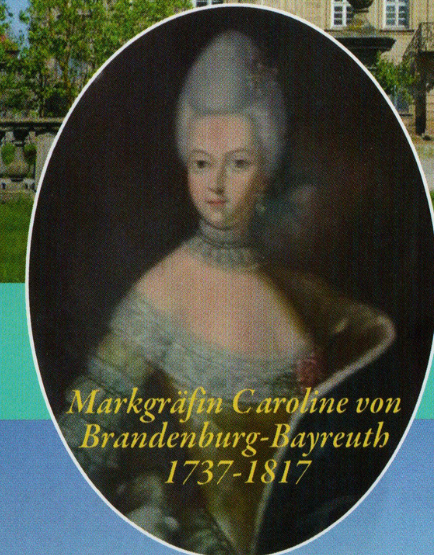
Markgräfin Caroline von Brandenburg-Bayreuth 1737-1817