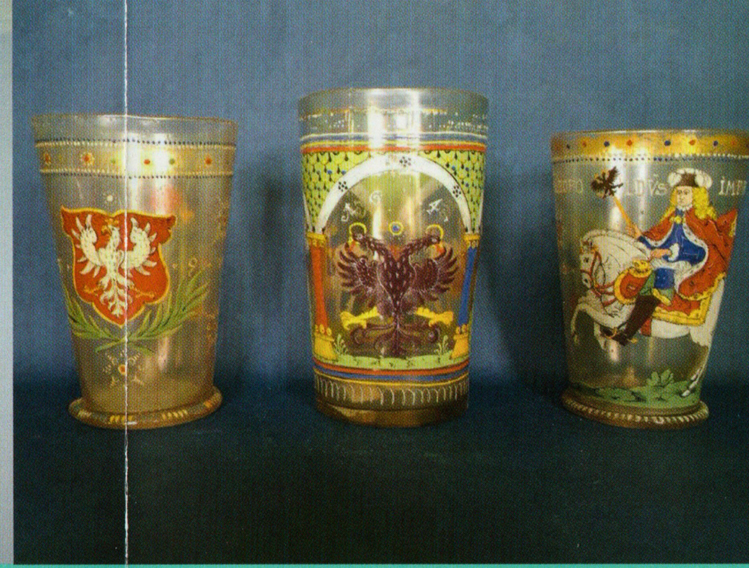
Fichtelgebirgsgläser, 2. H. 17. Jb.