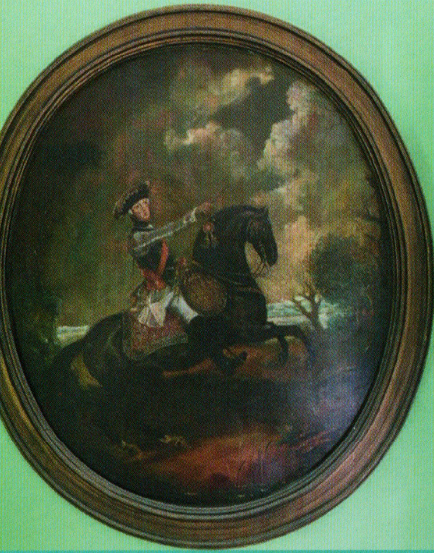
Markgraf Georg Wilhelm zu Pferd, 1678–1726