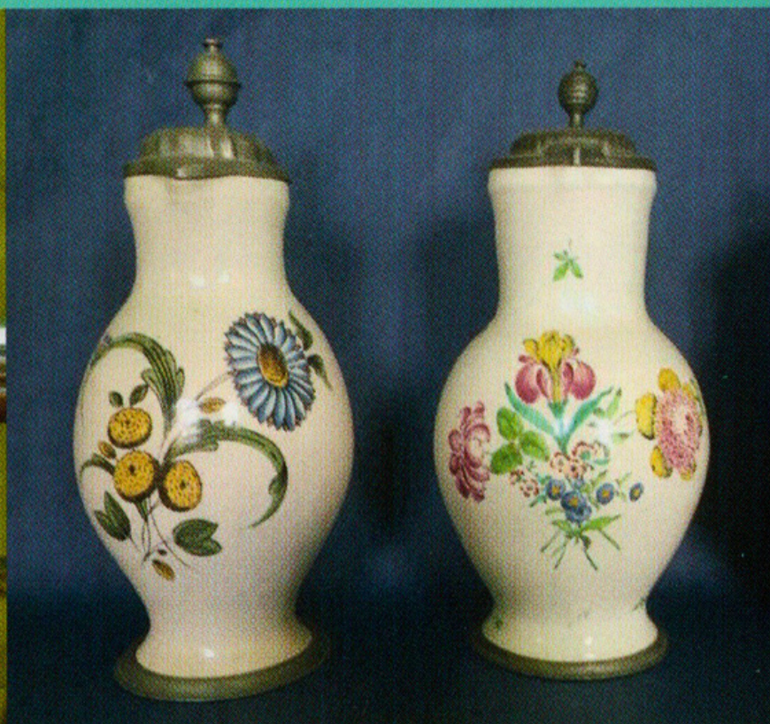
Bayreuther Fayence-Birnkrüge, 2. H. 18. Jb