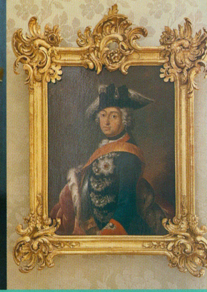
Friedrich d. Große, 1712–1786 Gem. von Antoine Pesne 1739