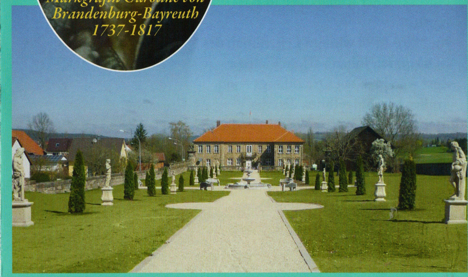
Barockgarten mit Gardehäuschen, Springbrunnen, Marmorgartenbänken und Gartenplastiken. (Neuanlage im Winter 2021/22 nach den alten Originalplänen)