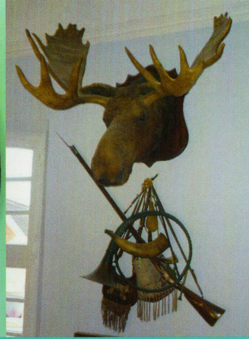
Kapitaler Elchkopf, 19. Jb.