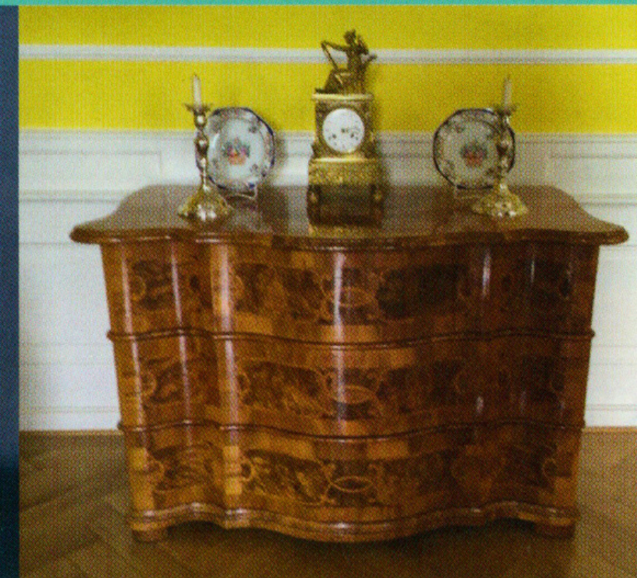
Kommode der Gebr. Spindler, 1755/60