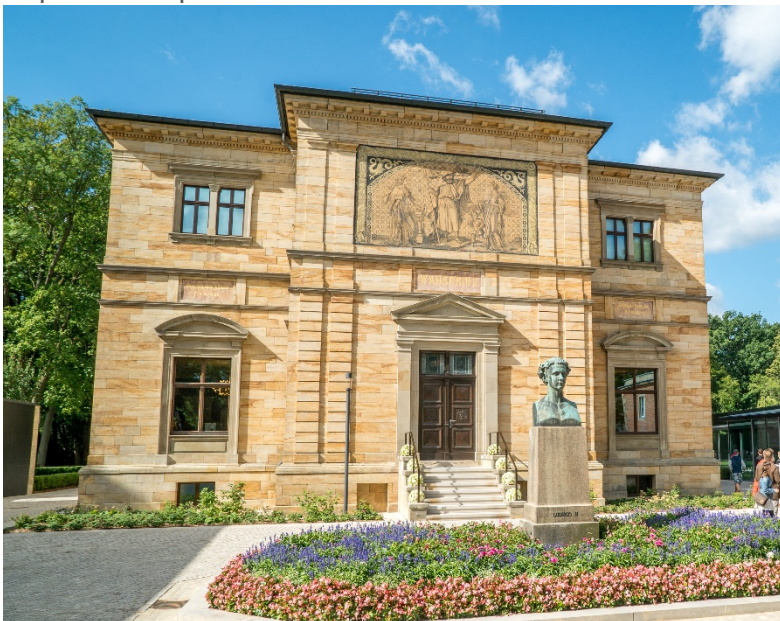
Le Musée Richard Wagner

Le Musée Richard Wagner présente la vie et l'œuvre de Richard Wagner ainsi que l'histoire du Festival de Bayreuth. Il offre une façon unique d'explorer ce lieu significatif de l'histoire culturelle allemande ainsi que le travail et les créations musicales de Richard Wagner dans l'exposition multisensorielle. L'aura unique de la Maison Wahnfried, un lieu culturellement significatif, authentique domicile et lieu de travail avec une histoire variée et complexe, et en tant que lieu d'événements, ainsi que le programme changeant des expositions spéciales dans le nouveau Musée Richard Wagner voisin, rendent les visites répétées intéressantes. Le musée est un lieu de rencontre et de recherche avec des archives, des espaces d'exposition et un lieu d'événements.