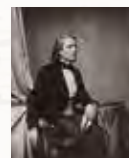
Franz Liszt. Photo- graphie von Franz Hanf- staengl, München 1858.