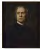
Franz Liszt. Ölgemälde von Franz v. Lenbach, um 1870.