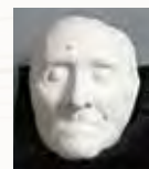
Franz Liszts Totenmaske. Gipsabguss von Bild- hauer Ludwig Weißbrodt, Bayreuth.